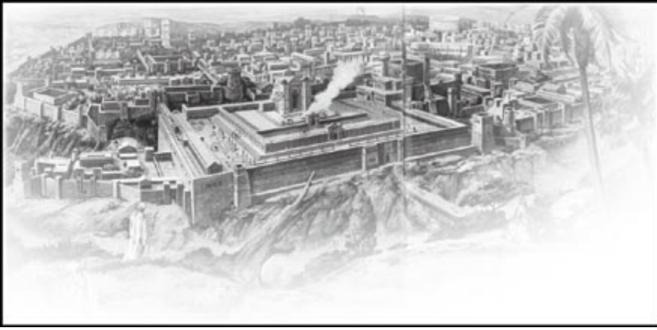
الهيكل القديم قبل الإسلام