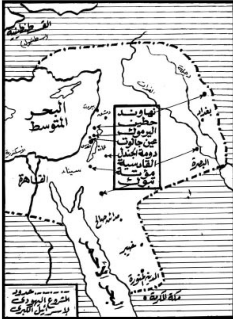
أطماع اليهود المستقبلية في أرض الأمجاد الإسلامية